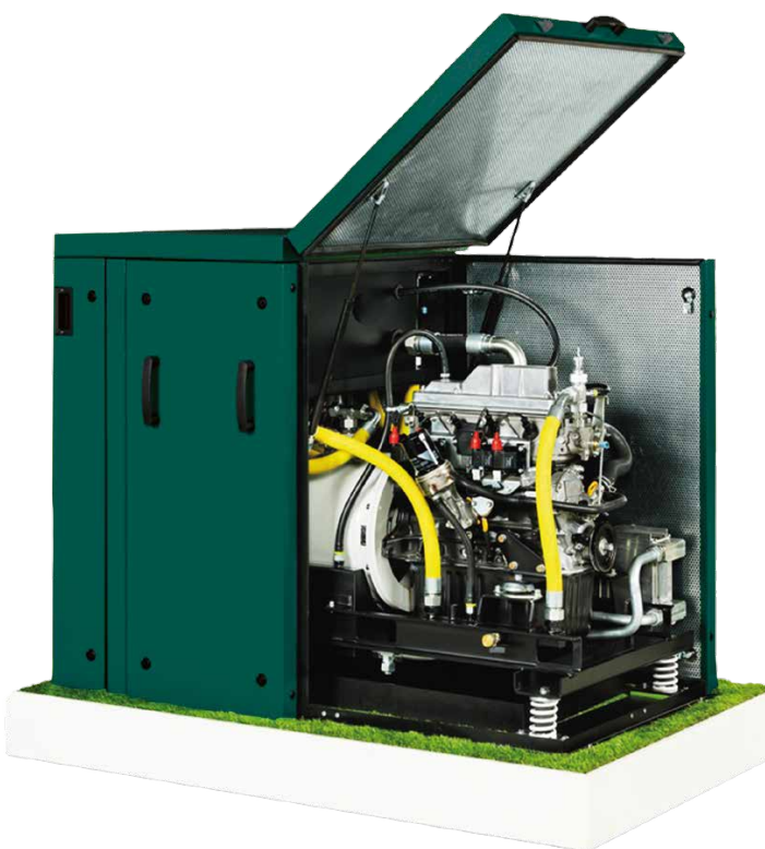
Dachs Pro G/F20.0

Die doppelte Nutzung des eingesetzten Brennstoffs macht die Kraft-Wärme-Kopplung hocheffizient. Bei dem neuen Dachs Pro G/F20.0 liegt der Gesamtwirkungsgrad bei bis zu 102,4 Prozent. Damit erzielt die Anlage die Energieeffizienzklasse A++ und ist langfristig eine sichere Option für niedrige Energiekosten, unabhängig von den steigenden Preisen des Energiemarktes.